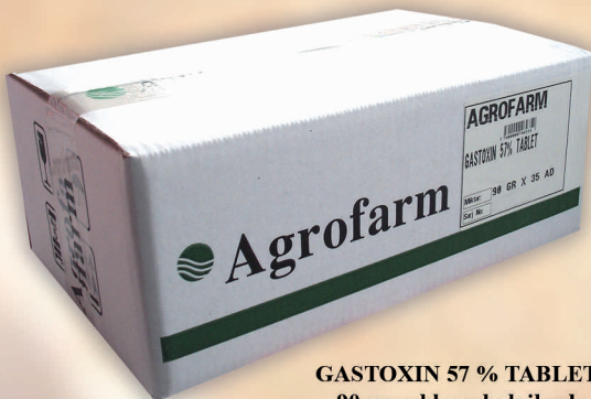
GASTOXİN 57 % TABLET, 90 gramlık ambalajlarda kolisinde 35 adet bulunmaktadır.