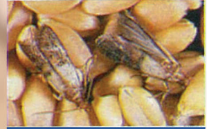
Kuru Meyve Güvesi