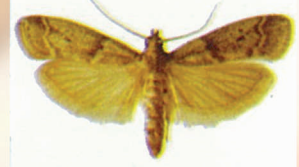
Tütün Güvesi (Ergin)