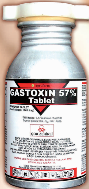
GASTOXİN 57 % TABLET, 3'er gramlık tabletler halinde ambalajında 30 adet bulunmaktadır.